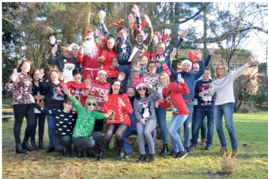
Cette photo a été prise avant les mesures relatives au COVID 19 en décembre 2019

L'équipe du Foyer de la région de Fléron